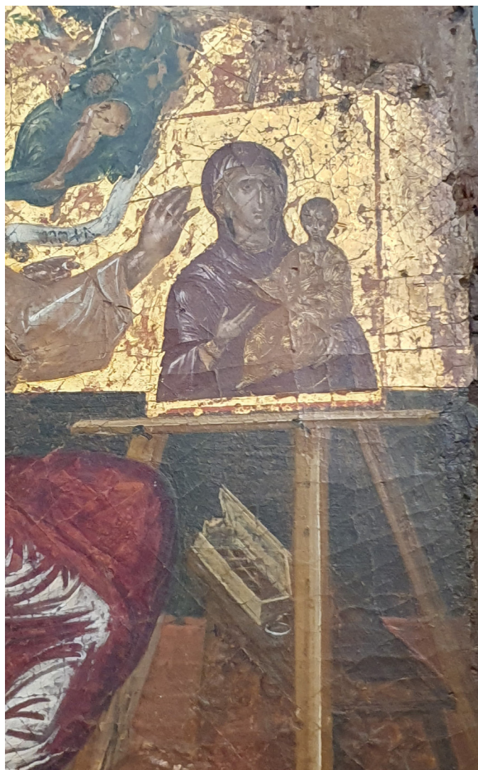
L'apôtre Luc peignant la Vierge, Doménikos Théotokopoulos dit El Greco vers 1564, (41 x 33 cm), Musée Benaki, Athènes, Grèce (détail).

Faculté des arts, Lettres, Langues et Sciences Humaines & Faculté de Droit et Science Politique