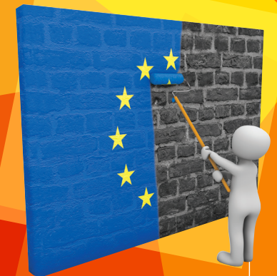
ATELIER DE CULTURE EUROPÉENNE