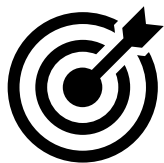
Tableau d'avancement : changement de grade