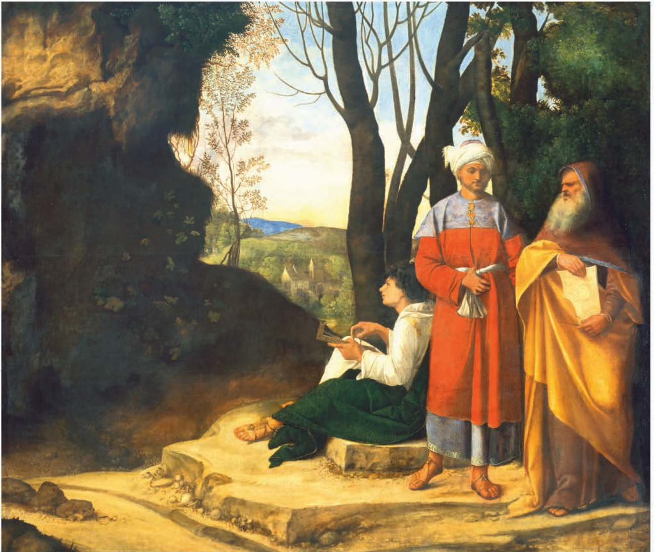
1. GIORGIONE (Giorgio Barbarelli dit), Les trois philosophes , 1505-1509, huile sur toile, 123 x 144 cm. Musée des Beaux-Arts et d'Archéologie, Vienne.