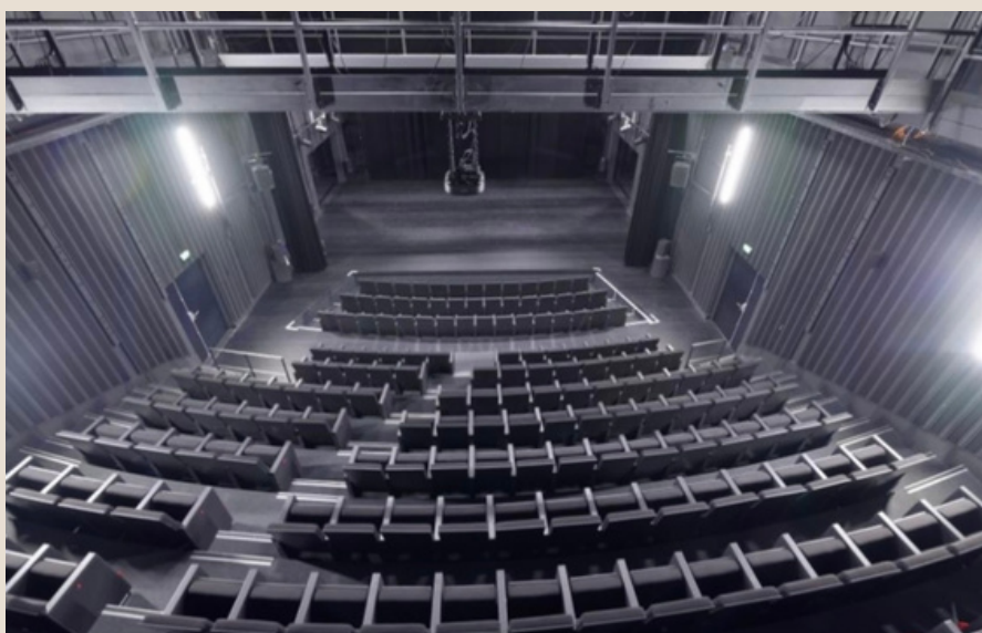
Salle et Scène du Théâtre