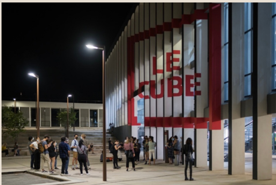
Facade/Entrée Théâtre Antoine Vitez