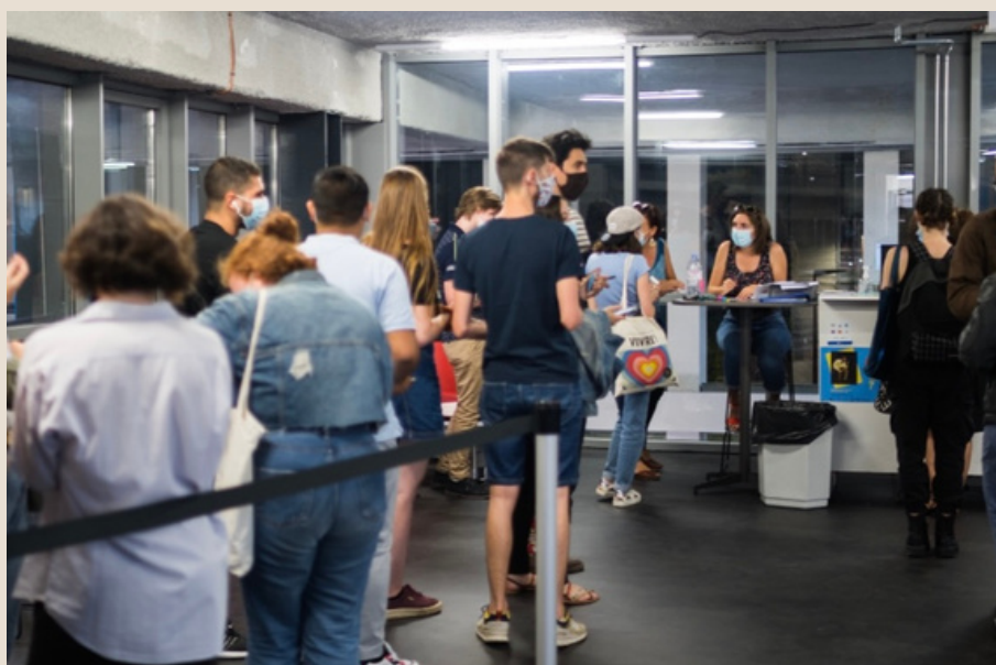
Hall et Accueil du Théâtre