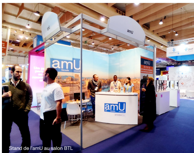
Stand de l'amU au salon BTL

Entre février et mars 2026, le Département d'Études Portugaises et Brésiliennes (DEPB) d'Aix-Marseille Université a ainsi été présent à Lisbonne lors de deux rendez-vous majeurs - la BTL 2026 et Futurália 2026 - qui ont permis de renforcer la visibilité internationale de ses formations, de développer des contacts professionnels et de mieux comprendre les évolutions des secteurs du tourisme, de l'enseignement supérieur et de la mobilité étudiante.