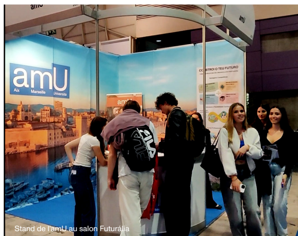
Stand de l'amU au salon Futurália

Ces participations ont également illustré une ligne de travail de plus en plus affirmée au sein du DEPB : faire dialoguer formation, rayonnement international, observation des milieux professionnels et présence active sur les espaces où se rencontrent institutions, étudiants, partenaires et futurs publics. Ce retour sur la BTL et sur Futurália permet ainsi de mettre en lumière, de manière plus posée, le travail accompli tout au long de l'année par les équipes enseignantes et les étudiants mobilisés.